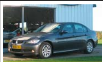
BMW 318 2.0d Business

16" LM Velgen, aut. Airco, Navigatie, Parkeersensoren.