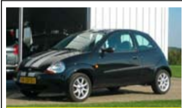
Ford Ka 1.3i Cool&Sound

14" LM velgen, Airco, Radio/CD, Elek. ramen.