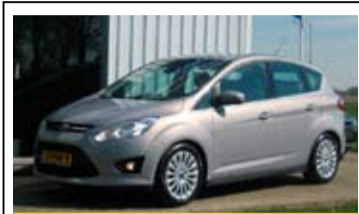
Ford C-max 1.6l Ecoboost Titanium

17" LM Velgen, aut. Airco, Navigatie, Parkeersensoren.