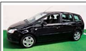
Ford C-MAX 1.8-16v Futura