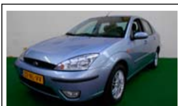
Ford Focus Sedan 1.6 Ghia Automaat