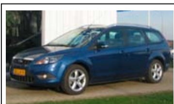
Ford Focus 1.6i Comfort Style Pack

16" LM Velgen, Airco, Elek. ramen en spiegels, Radio/CD-speler.