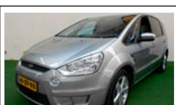
Ford S-MAX 2.0-16v Titanium

7-persoons, Trekhaak, Airconditioning, Cruise control.