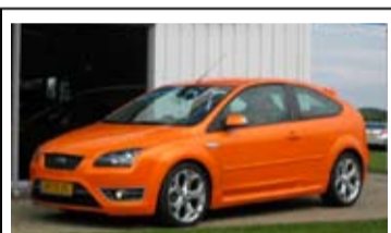
Ford Focus 2.5l Turbo ST

18" LM Velgen, aut. Airco, Sony radio, 225 pk!