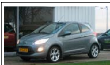
Ford Ka 1.2l Titanium

16" LM Velgen, Spoiler, Airco, Elek. ramen.