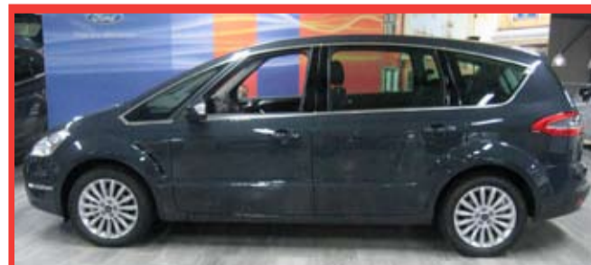
Ford S-MAX Titanium