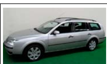
Ford Mondeo 1.8-16v Trend

Airconditioning, LM Velgen, Cruise control.