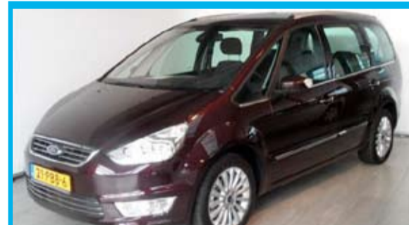
Ford Galaxy 2.0i Titanium Business