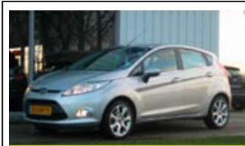
Ford Fiesta 1.25l Titanium

16" LM Velgen, aut. Airco, Parkeersensoren, Voorruitverwarming.