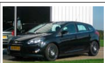
Ford Focus 1.6l Ecoboost Titanium

17" LM Velgen, aut. Airco, Radio/CD, Voorruitverwarming.