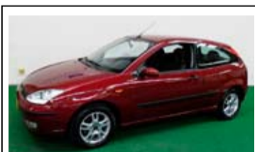
Ford Focus 3D 1.6-16v Limited