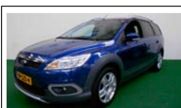
Ford Focus Wagon 1.6-16v X

Airconditioning, Radio/CD, Voorruitverwarming.