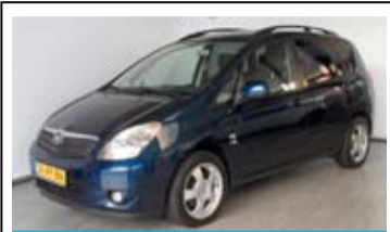
Toyota Corolla Verso 1.8l 16v Linea Sol

BEKIJK ONZE COMPLETE VOORRAAD OP WWW.JOSBOGMAN.NL