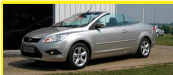
Ford Focus Coupé-Cabriolet 1.6i 16v 100pk Cool & Sound