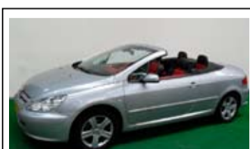
Peugeot 307 CC 2.0-16v

Airconditioning, Leren bekleding, LM velgen.