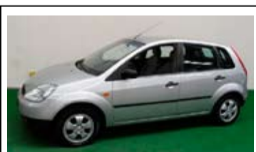
Ford Fiesta 1.3 Core 5-drs.