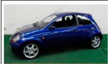
Ford Ka 1.6 Sport