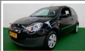
Ford Fiesta 1.3 Champion

Airconditioning, Radio/CD, Stuurbekechtiging