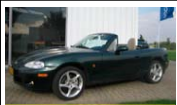
Mazda MX-5 1.6l Touring cabrio

16" LM Velgen, Airco, Elek. ramen en spiegels.