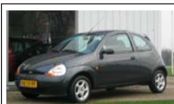
Ford Ka 1.3l Cool & Sound

14" LM Velgen, Airco, Radio/CD, Elek. ramen.