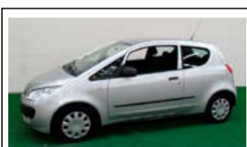
Mitsubishi Colt 1.1 Inform

Airconditioning, Radio/CD, Stuurbekechtiging.