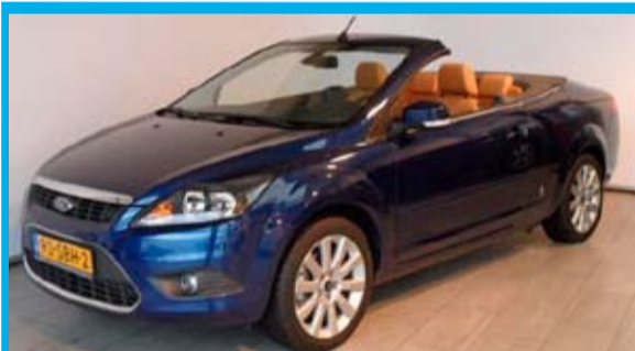
Focus Limited 2.0 Automaat