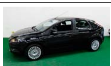
Ford Focus 1.8 - 16v Limited

Navigatie, PDC, Airconditioning, LM velgen.