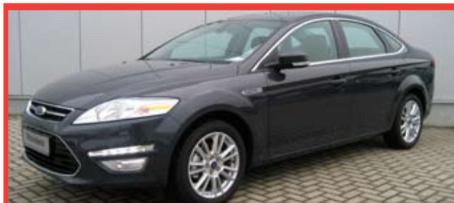
Ford Mondeo 2.0 Sedan