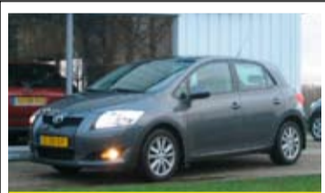
Toyota Auris 1.6l Executive Bns

16" LM Velgen, aut. Airco, Navigatie, Parkeersensoren.