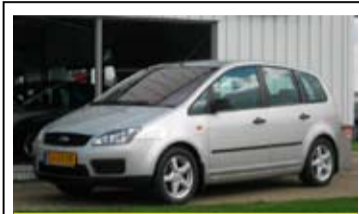
Ford C-max 1.6l Champion

16" LM Velgen, Airco, Radio/CD, Elek. ramen + spiegels.